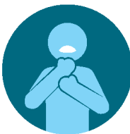
Dificultad para respirar